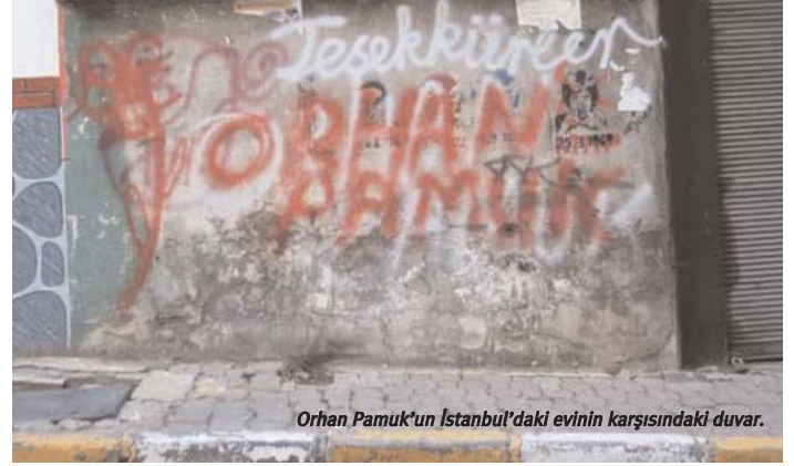
Orhan Pamuk'un İstanbul'daki evinin karşısındaki duvar.

bürokrasi bu kesimlerin başında geliyorlar. Bu nedenle 301. maddeyi sıkı sıkıya tutunup, eleştirenlere tehdit savuruyorlar. 301. maddeyi savunmak için ne kadar vatan-millet edebiyatı varsa yapan bu kesimlerin, en büyük savunusu "her ülkenin kendini korumak için böyle bir maddesi olduğu ve onu kullandığı" yönünde. Aslı astarı olmayan böyle bir iddia, şimdiki kadar hangi ülkede kimin böyle bir maddeden yargılandığı