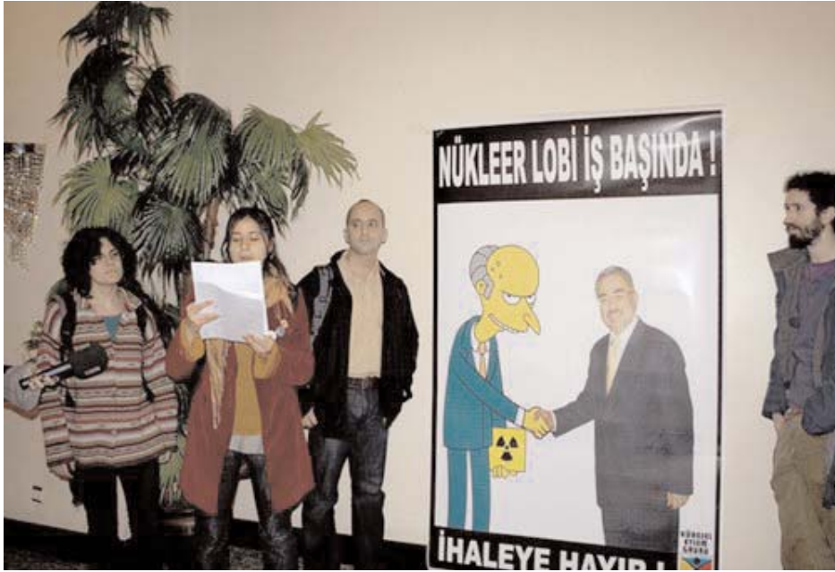
KEG aktivistlerinin doğrudan eylemi nükleerlileri sınırlendirdi. Nerede nükleer lobisi varsa orada protesto var.