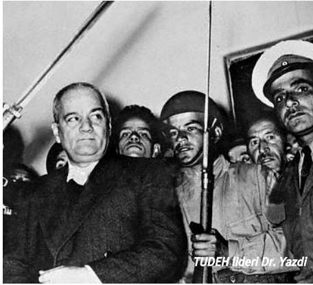
TUDEH lideri Dr. Yazdi

9 Eylül'de Tahran'daki petrol rafinerisinde çalışan 700 işçi sıkıyönetim ilanını ve önceki günkü katliamı protesto etmek için greve çıktı. Grev 48 saat içinde İsfahan, Abadan, Tebriz ve Şiraz'daki rafinerilerle sıcağı. Öne çıkan talepler yüzde 100 ücret artışı, yöneticilerin işten alınması, sosyal yardım ve hizmetlerin iyileştirilmesi,