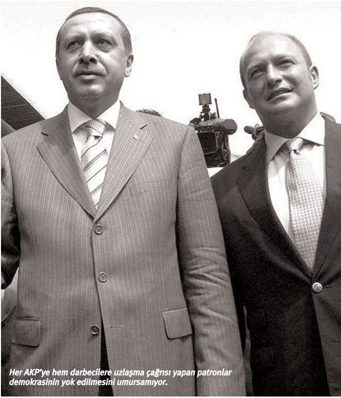
Her AKP'ye hem darbecilere uzlaşma çağrısı yapan patronlar demokrasinin yok edilmesini umursamıyor.