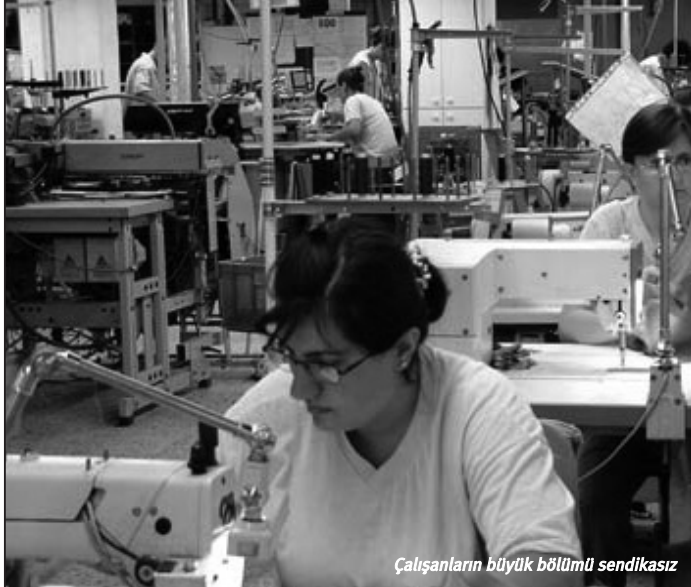
Çalışanların büyük bölümü sendikası

Türk-İş yönetimi 12 Eylül sonrası hükümetle çalışma bakanı vermişti. Sosyal demokratlar uzun yıllar Türk-İş'e hakim oldu. Onların uzlaşmacılıkları MHP'li sendikacıların