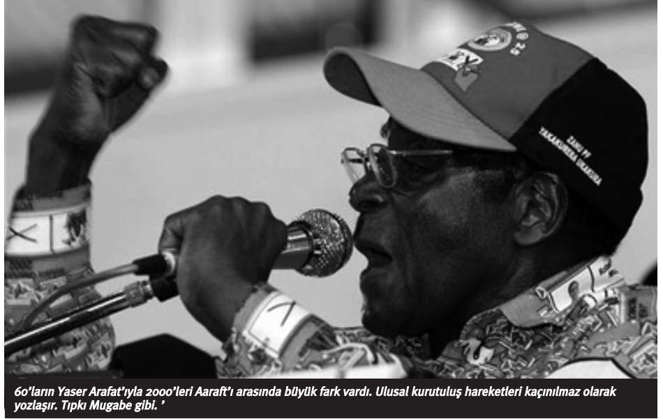
60'ların Yaser Arafat'ıyla 2000'leri Aarafat'ı arasında büyük fark vardı. Ulusal kurutuluş hareketleri kaçınılmaz olarak yozlaşır. Tıpkı Mugabe gibi. '

Mugabe işte bu direnişi durdurmak için "anti-emperyalist" kesildi ve topraksız savaş gazilerinin sefaletini hatırladı.