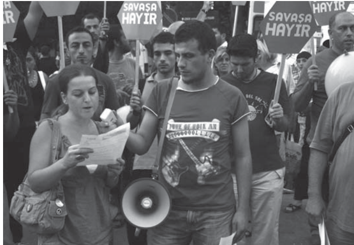
31 Ağustos, İzmir Fuarı'nda Küresel BAK basın açıklaması

Küresel Barış ve Adalet Koalisyonu Eylül ayı için bir dizi etkinlik planladı. Savaşların, işgallerin, operasyonların durması için, barıştan yana olan herkesi bu etkinliklerde yer almaya çağırıyor.