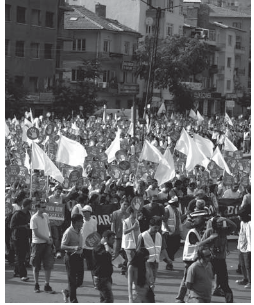
26 Temmuz, Ankara