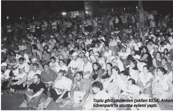
Toplu görüşmelerden çekilen KESK, Ankara Güvenpark'ta oturma eylemi yaptı.

1980'lerin sonlarından öğretmenlerin Eğitim-Der'i, belediye çalışanlarının Bel-Der-Der'i kurmasından 2000'lerin ortasına dek bir buçuk milyon civarındaki kamu emekçisinin tek temsilcisi KESK'ti. O zaman da üye sayısı 200 binin üzerindeydi. Sayısız eyleme imza atıp, işçi hareketinin öncü müfrezesi