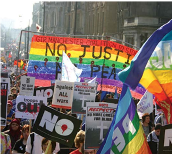
Küresel savaş karşıtı hareketi yeni bir mücadele dönemi bekliyor.

Soğuk Savaş'ın sona ermesiyle yeni emperyalizm dönemi başlamış oldu ve bu dönem eskisinden çok daha tehlikeli.