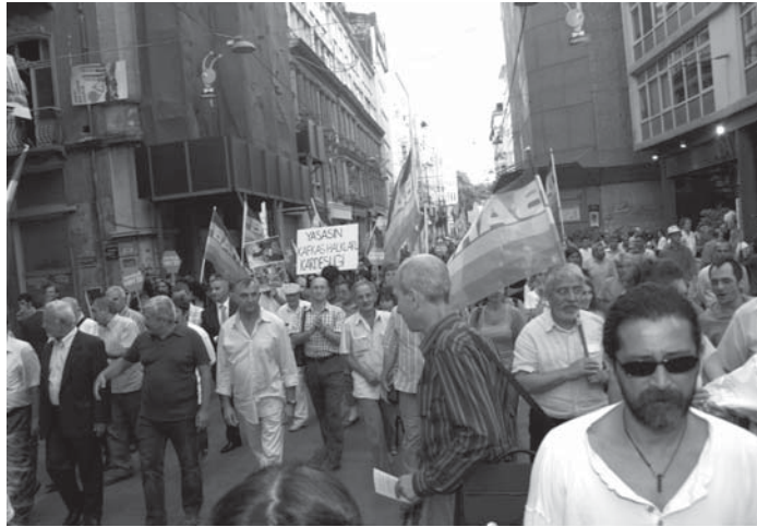
1 Eylül, İstanbul'da Tünel'den Galatasaray Meydanı'na yürüyüş