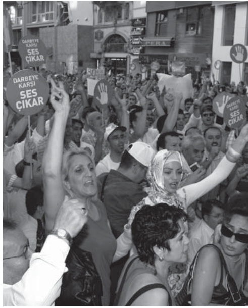
21 Haziran, İstanbul

İki simit parasına razı olmamak için mücadele her türlü boş lafın dışında, somut hedefler ile aşağıdan sürdürülebilir.